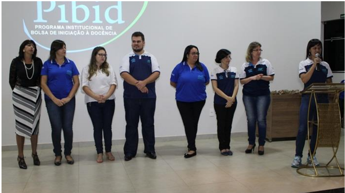
Imagem. Seminário de Encerramento do PIBID 2016. 2016.

o Alfabetizar letrando revelou aos alunos e professores uma postura interdisciplinar ativa, lúdica, alegre e prática.