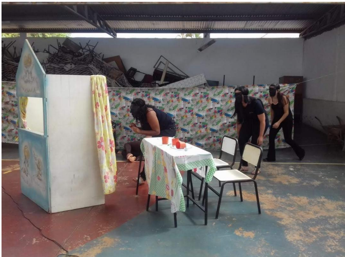
Imagem. Apresentação teatral das alunas bolsistas como incentivo para reescrita. 2019.