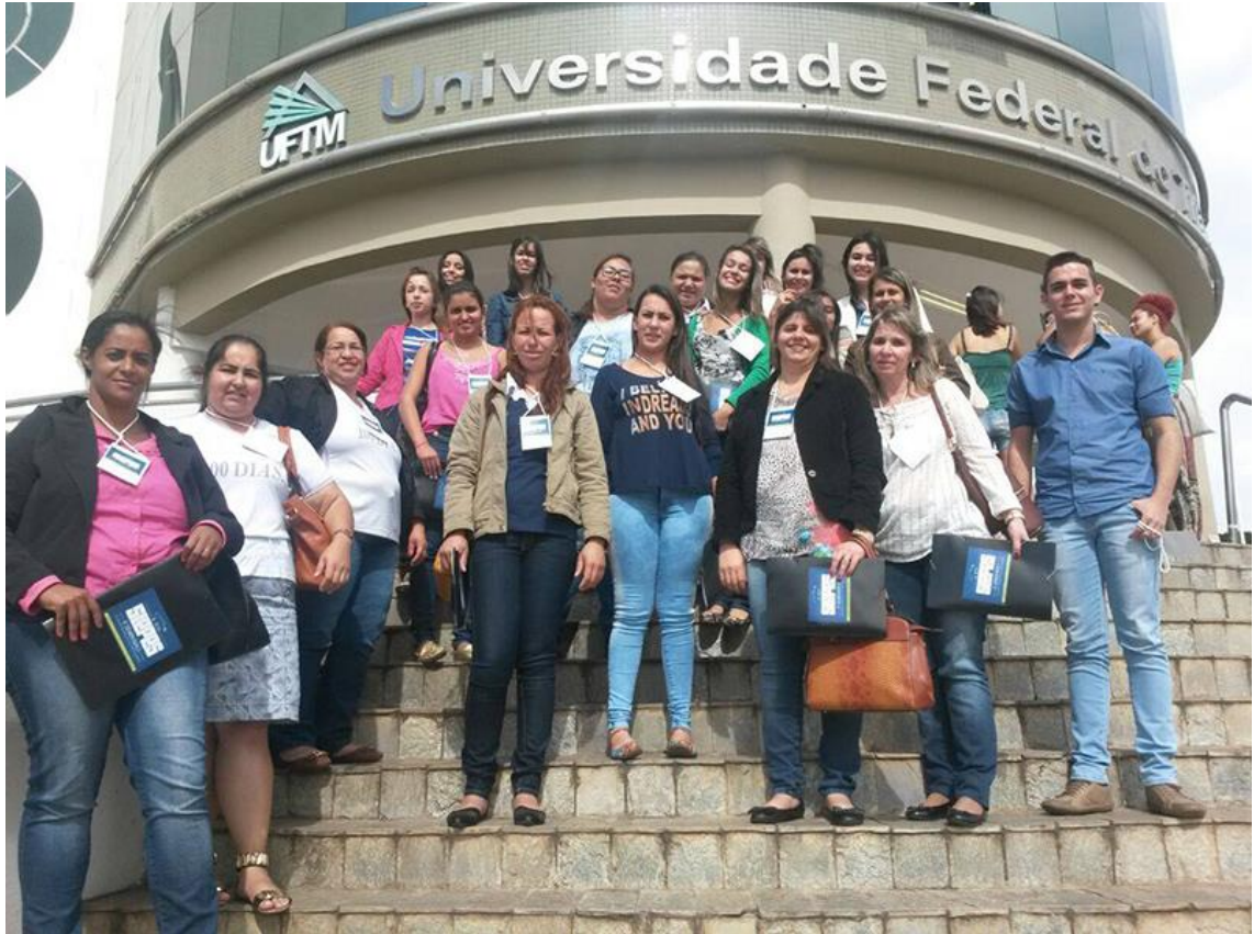
Imagem. Alunos bolsistas no SLEPES 2015, UFTM, Uberaba- MG. 2015.