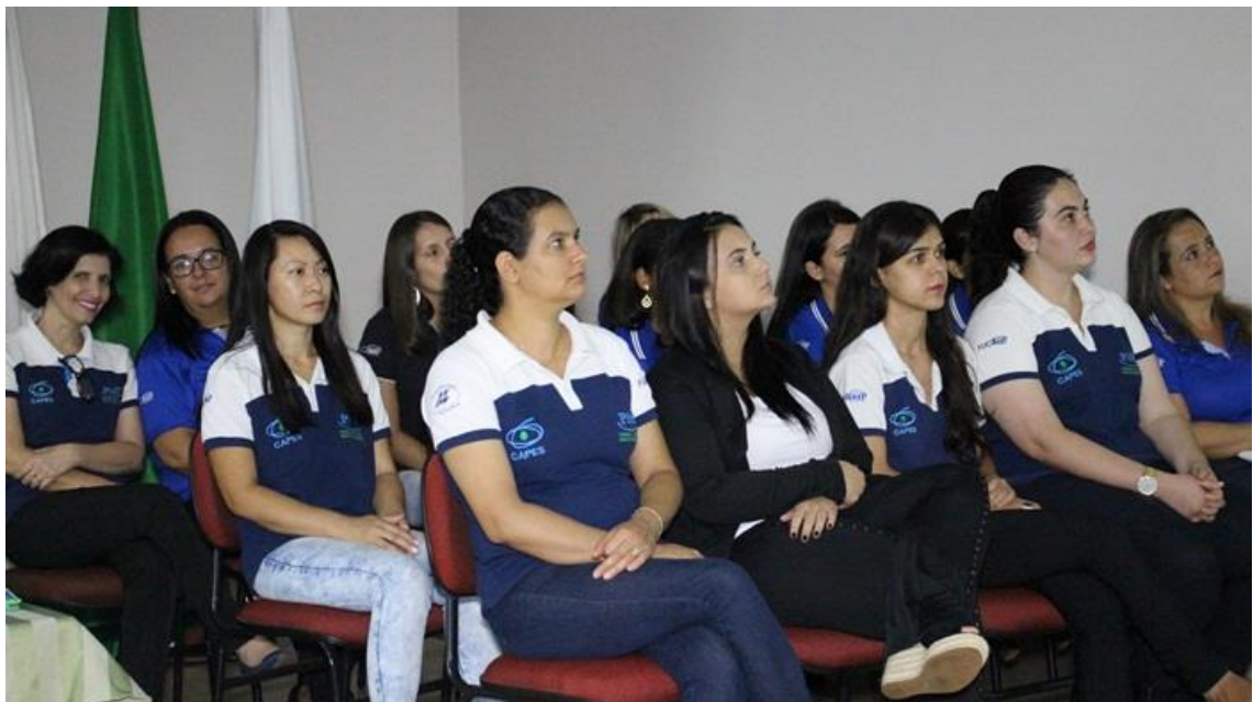
Imagem. Alunas bolsistas. Seminário de Encerramento do PIBID 2016. 2016.