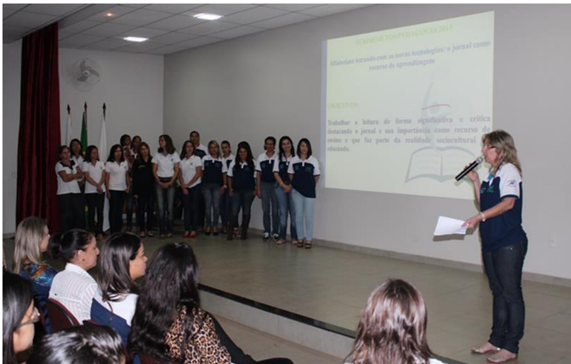
Imagem. Seminário de Abertura do PIBID 2015. Acervo do UNIFUCAMP. 2015.

O trabalho com o jornal permitiu entender que um dos papéis do professor é estabelecer laços entre a escola e a sociedade. Assim, levar jornais e revistas para a sala de aula é trazer o mundo para dentro da escola. É importante ressaltar que o jornal evidencia conteúdos interdisciplinares como História quando analisamos a repercussão na sua vida social, econômica e política: o espaço, o tempo; a Geografia com a degradação ambiental, a Matemática com seus gráficos, suas porcentagens, a Língua Portuguesa com suas palavras, interpretações, gêneros textuais. Dessa forma a utilização do jornal permitiu aos alunos perceber a conexão da escola com a vida.