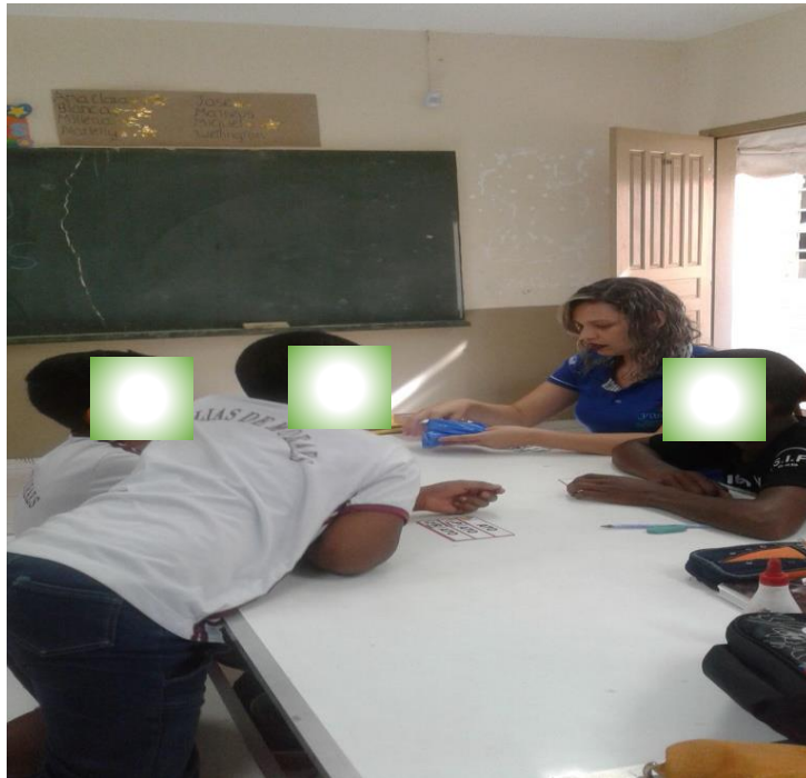
Imagem. Aluna bolsista aplicando atividade com jogos na escola campo. 2017.

O grupo de alunos foi dividido pela aproximação das necessidades de escrita e leitura para que pudessem criar uma harmonia entre os envolvidos e as atividades pudessem se adequar ao interesse e desenvolvimento dos alunos. Procurou-se agrupar crianças nos níveis pré-silábico e silábico e silábico-alfabético e alfabético.