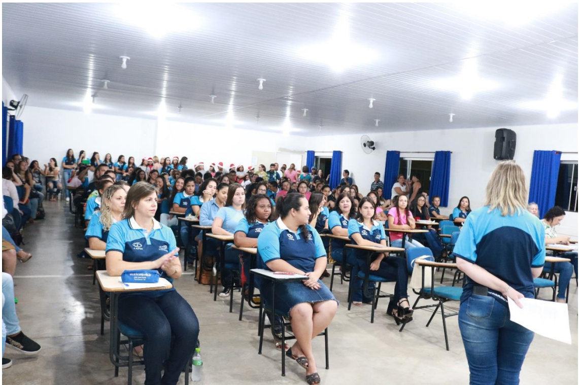
Imagem. Seminário de Encerramento do PIBID 2019. 2019.