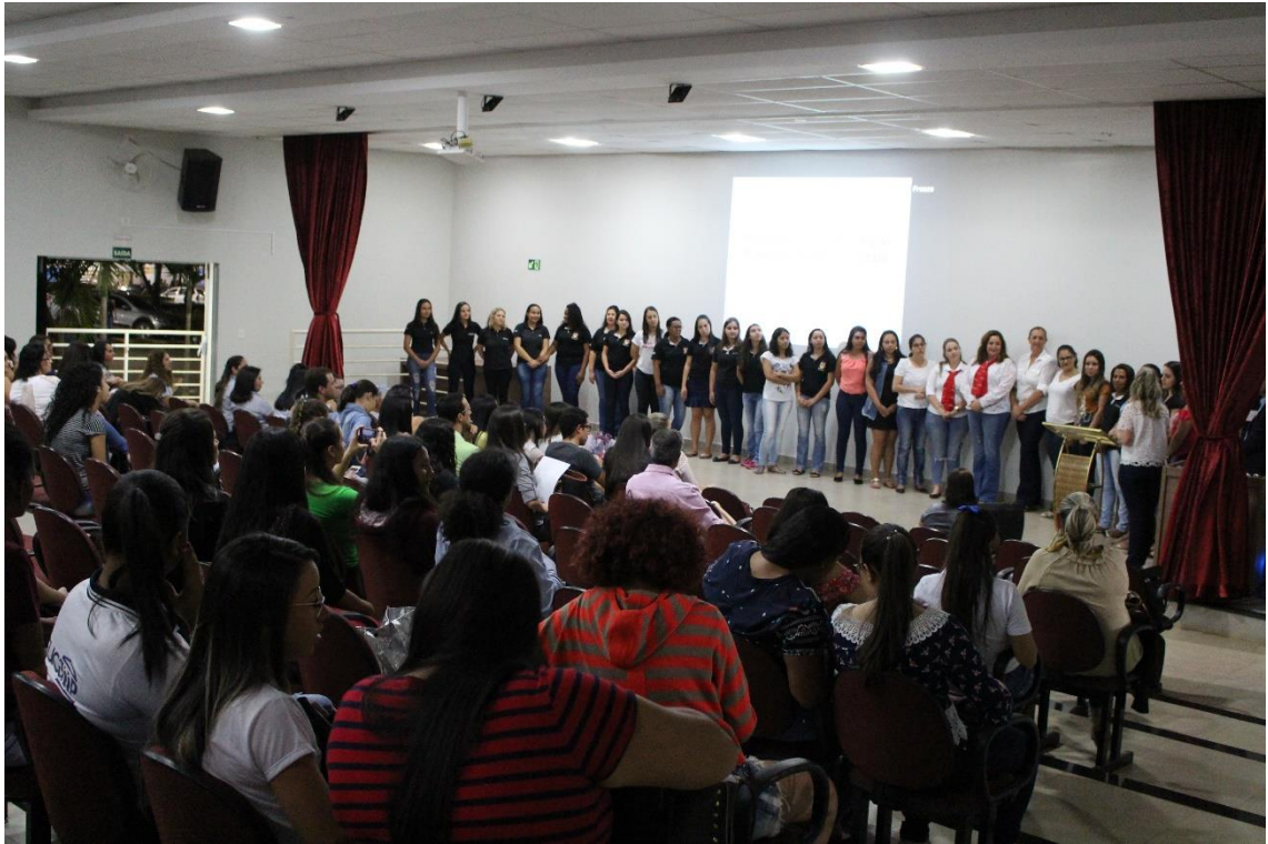
Imagem. Seminário de Abertura do PIBID 2018. Acervo do UNIFUCAMP. 2018.