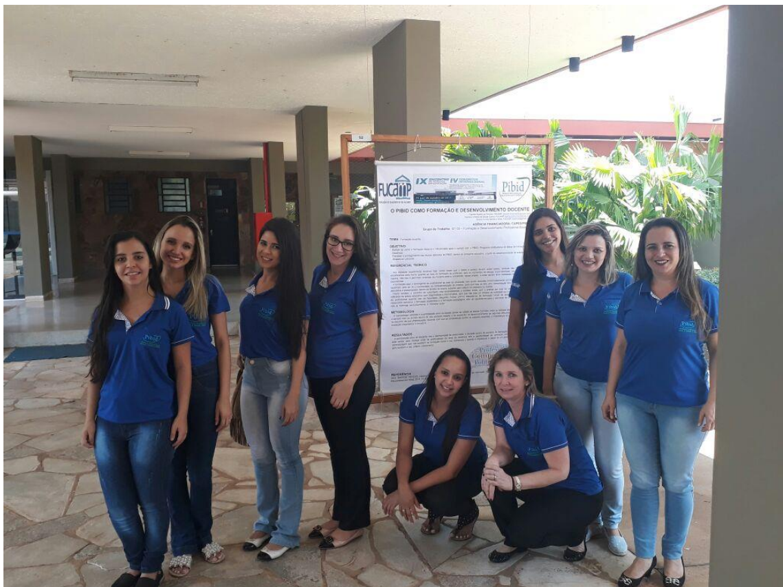
Imagem. Equipe das Alunas bolsistas no Congresso. Uberaba, MG. 2017.