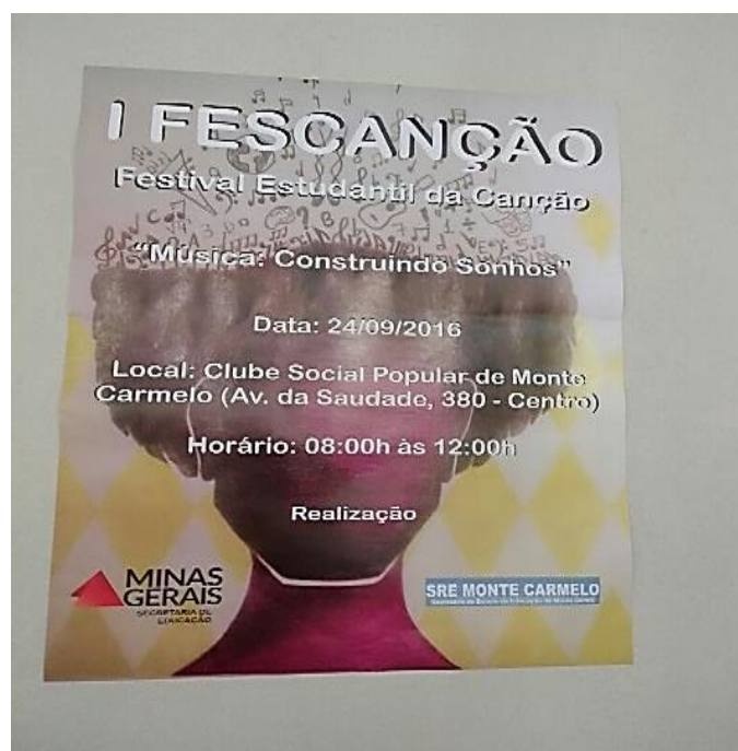
Imagem. Banner do I FESCANÇÃO. 2016.

Como culminância do Subprojeto houve, na rede municipal de Monte Carmelo, o FEST CANÇÃO e os alunos participaram com as paródias que foram elaborando durante todo o projeto.