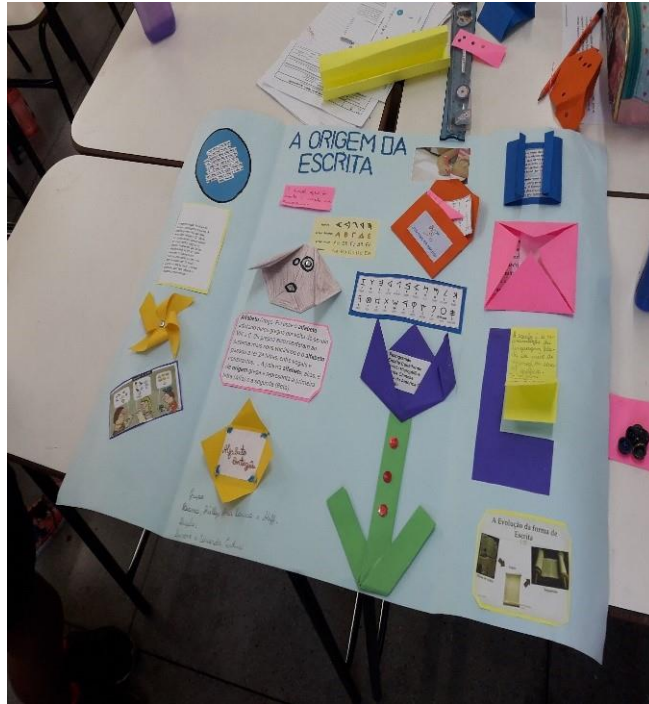
Imagem. Produção de um lapbook sobre a origem da escrita. Alunos do 1º ano do Ensino fundamental. 2018.