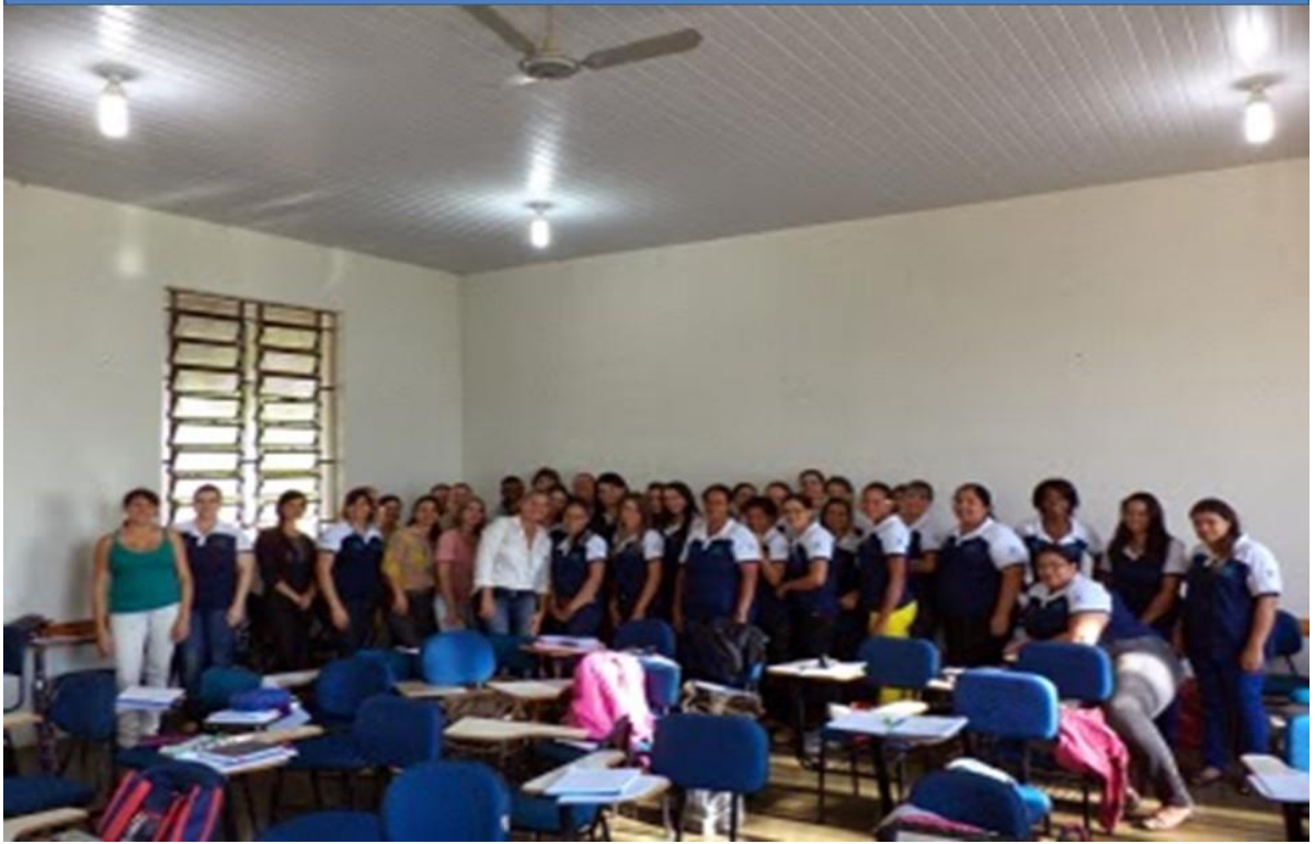
Imagem. Oficina de Escrita com Alunos Bolsistas dos Subprojetos de Pedagogia, Letras Português, Letras Inglês. Acervo da Coordenadora. 2014.