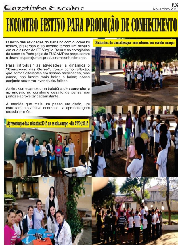
Imagem. Jornal Gazetinha Escolar publicado pelo Subprojeto de Pedagogia da UNIFUCAMP. Acervo da Coordenadora de Área, 2015.