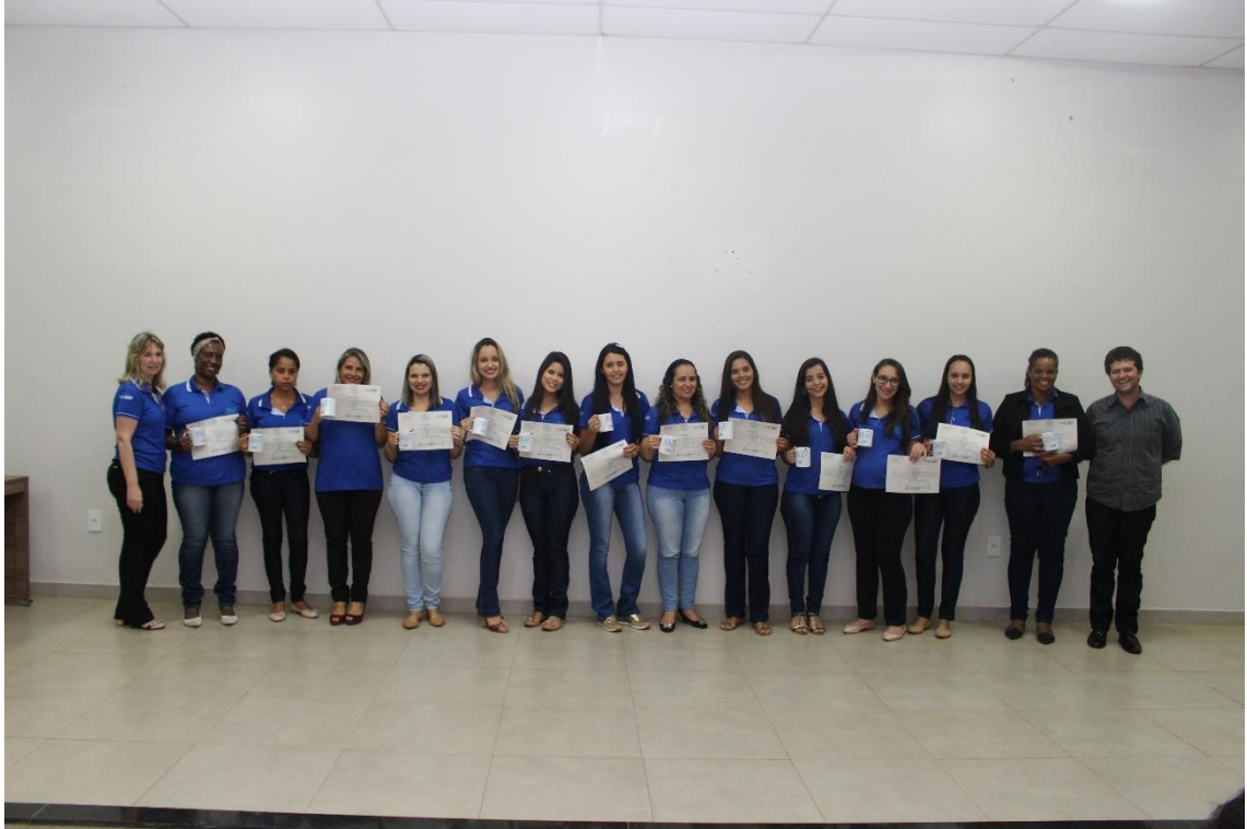
Imagem. Seminário de Encerramento do PIBID 2017. 2017.