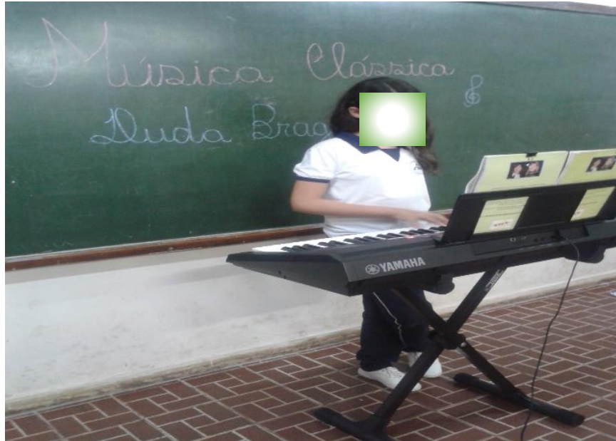
Imagem Aluna da escola campo apresentando um número musical. 2016.

Como culminância do Subprojeto houve, na rede municipal de Monte Carmelo, o FEST CANÇÃO e os alunos participaram com as paródias que foram elaborando durante todo o projeto.