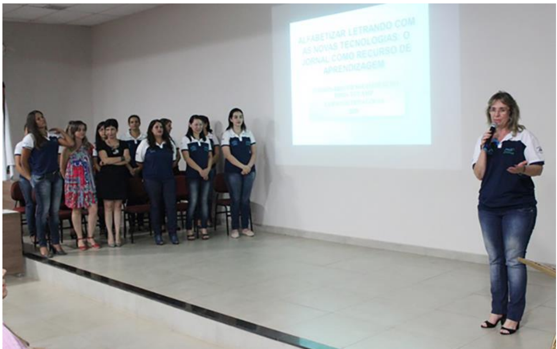
Imagem. Seminário de Encerramento do PIBID 2015. 2015.