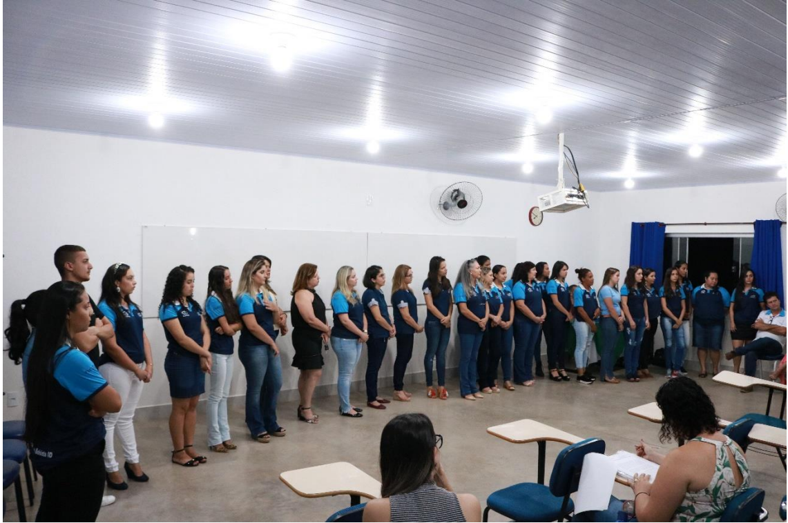
Imagem. Seminário de Encerramento do PIBID 2019. 2019.