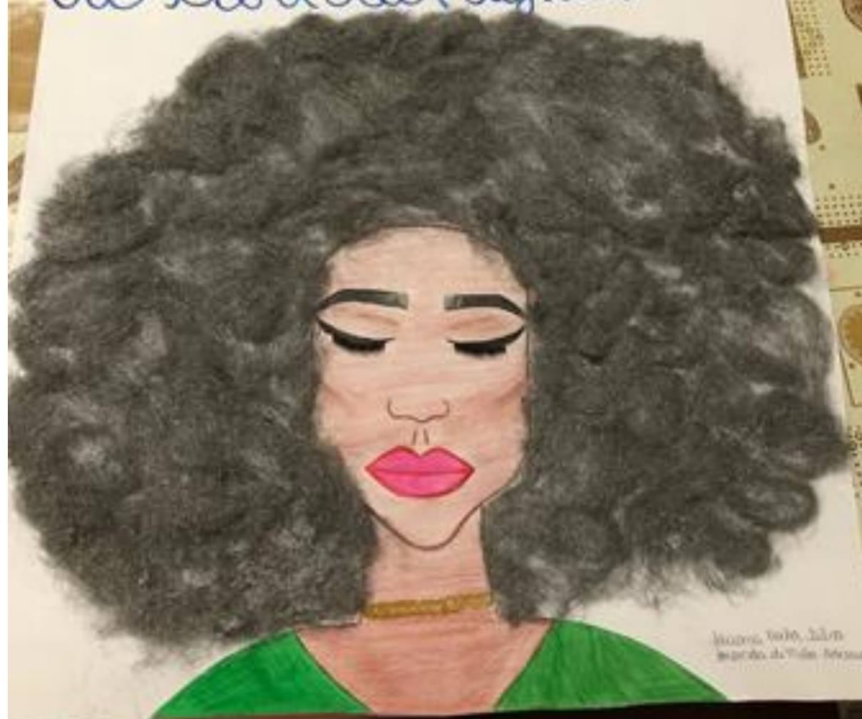
Ilustração: [unreadable] [unreadable]

Nossas cores são diversas, mas o respei- to deve ser igual.